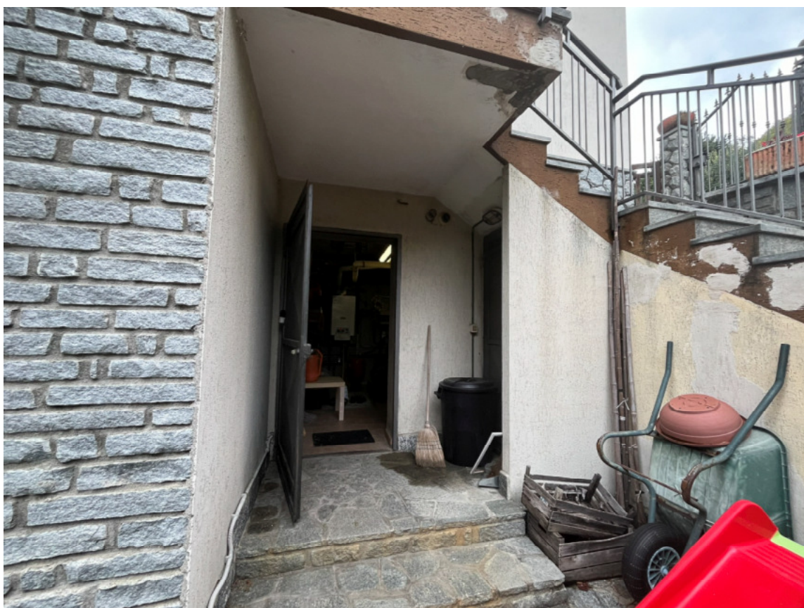
14_locale tecnico sottoscala