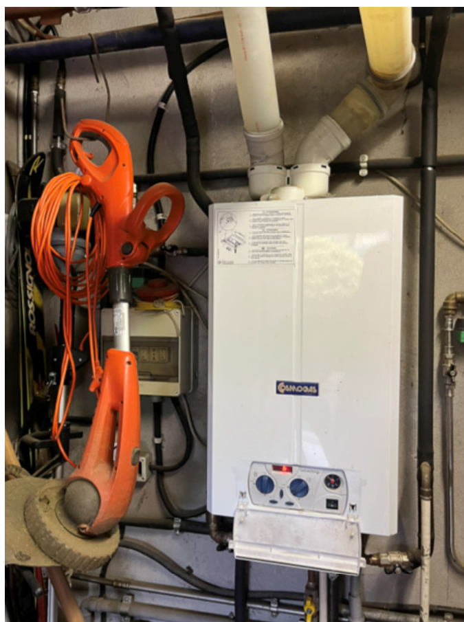
16_caldaia a servizio delle U.I.