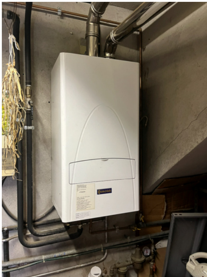
17_caldaia a servizio delle U.I.