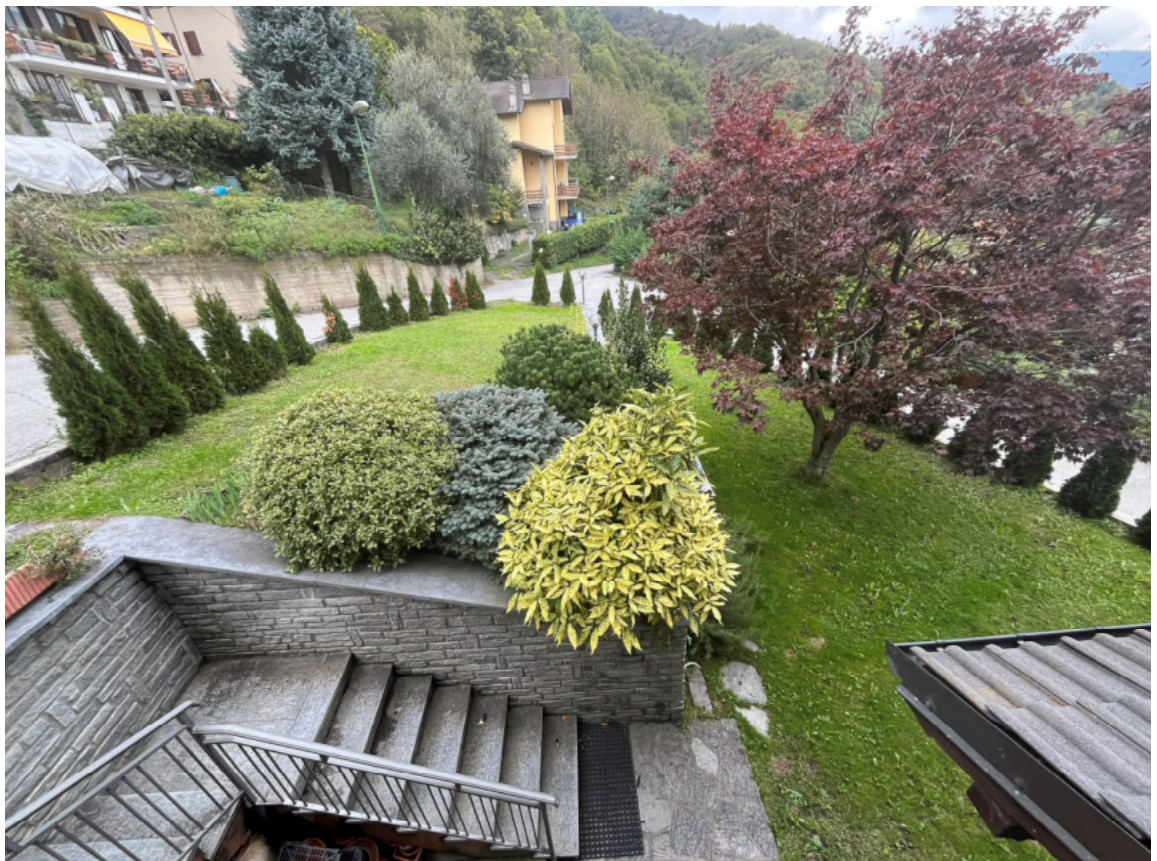
06_area di corte