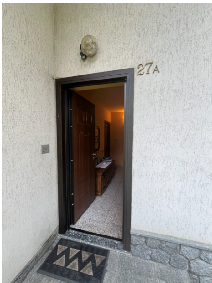
11_porta ingresso vano scala comune