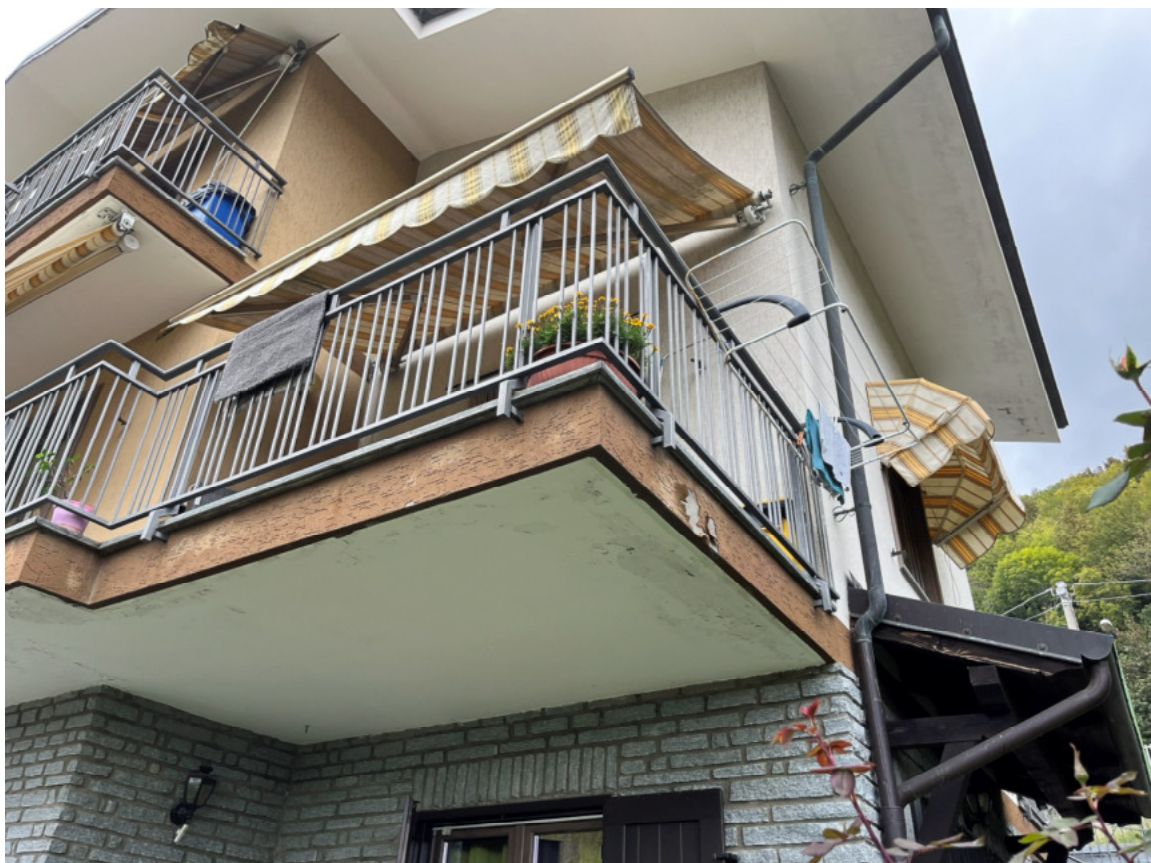
04_dettaglio frontalini balconi