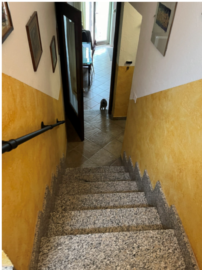
21_vano scale da P1 a PT