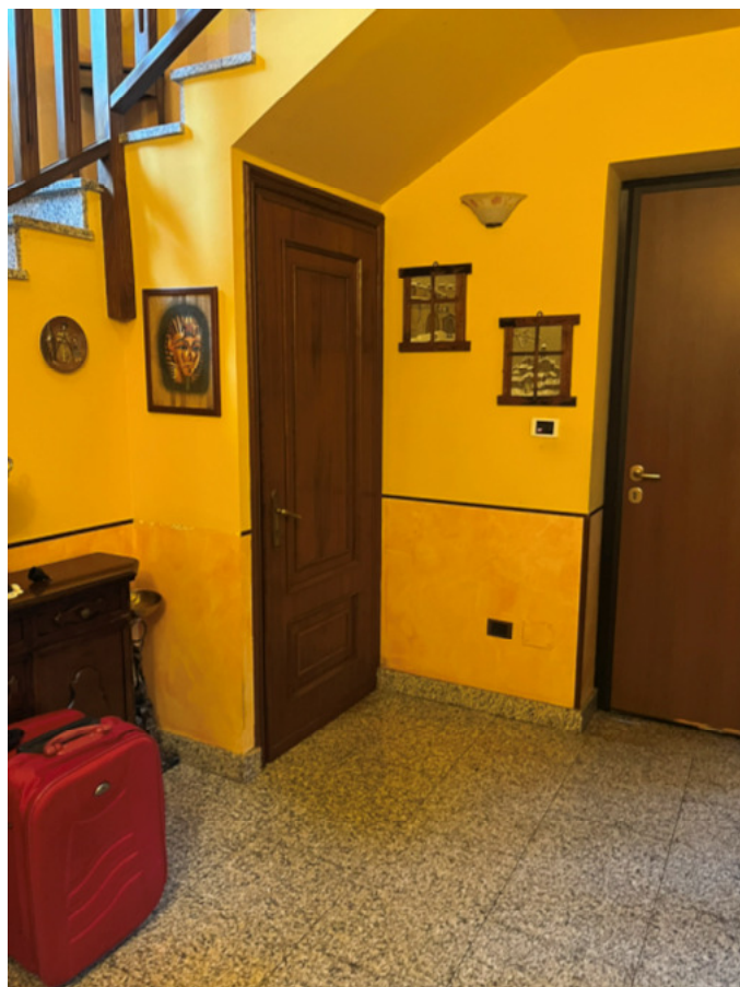
20_ingresso vano scala P1