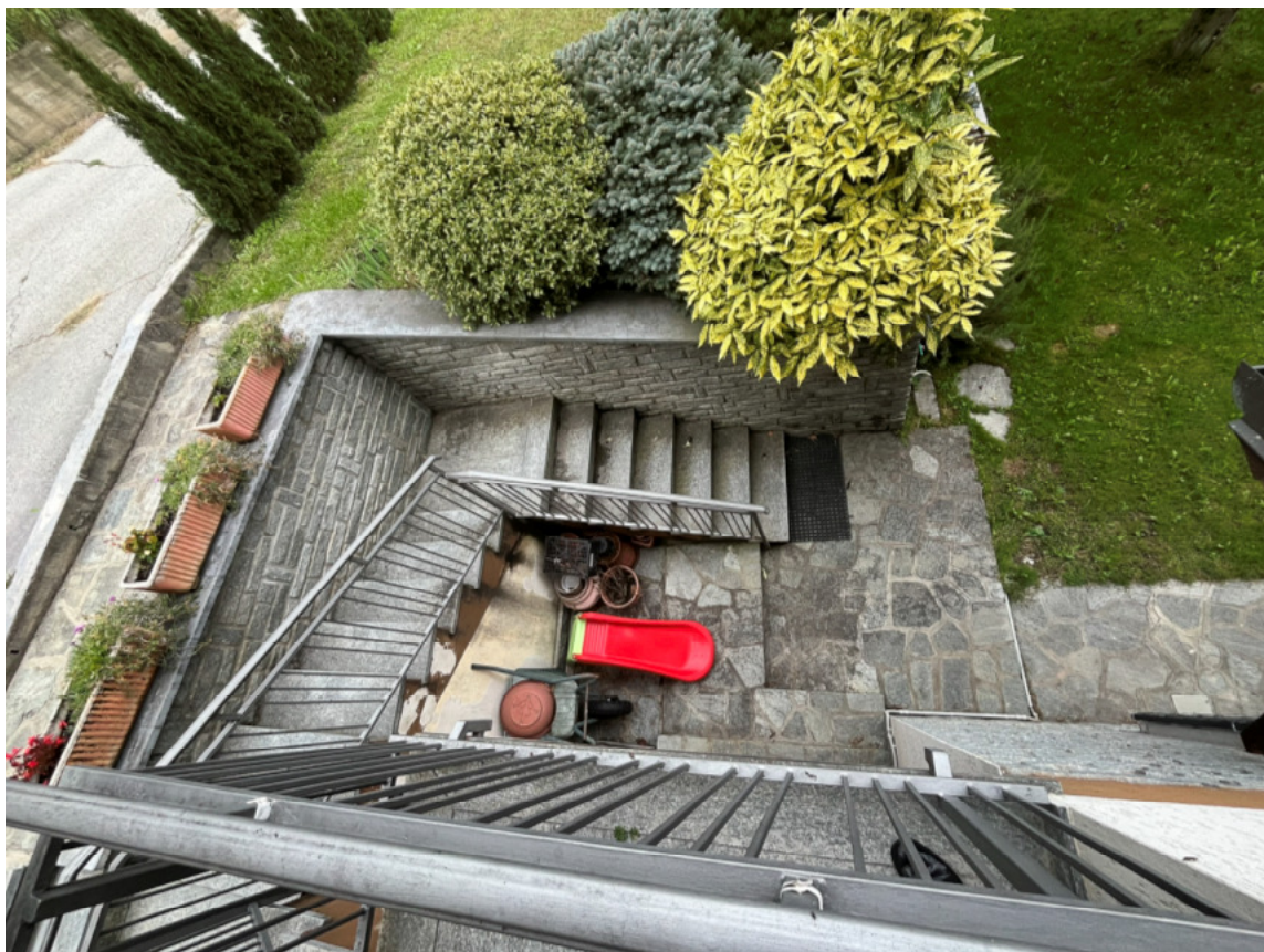
13_vano scala esterno