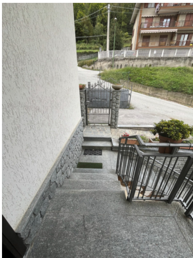
12_pianerottolo esterno vano scala comune