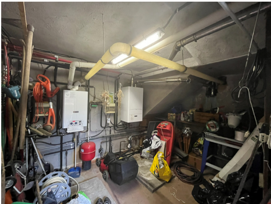
15_locale tecnico CT