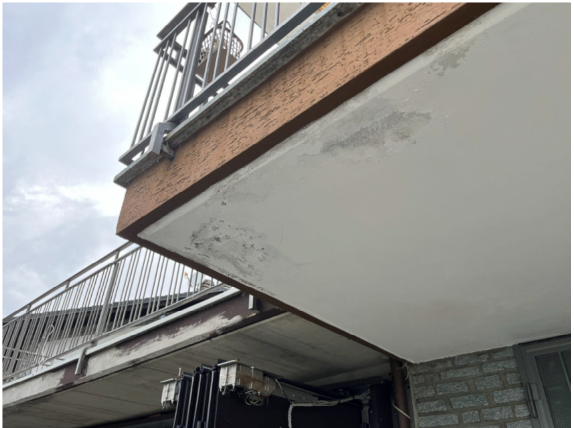
05_dettaglio intradosso balconi