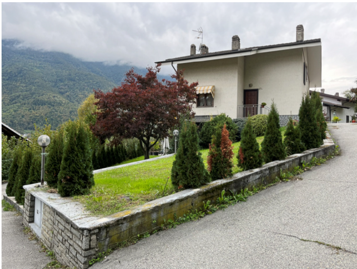
07_area di corte