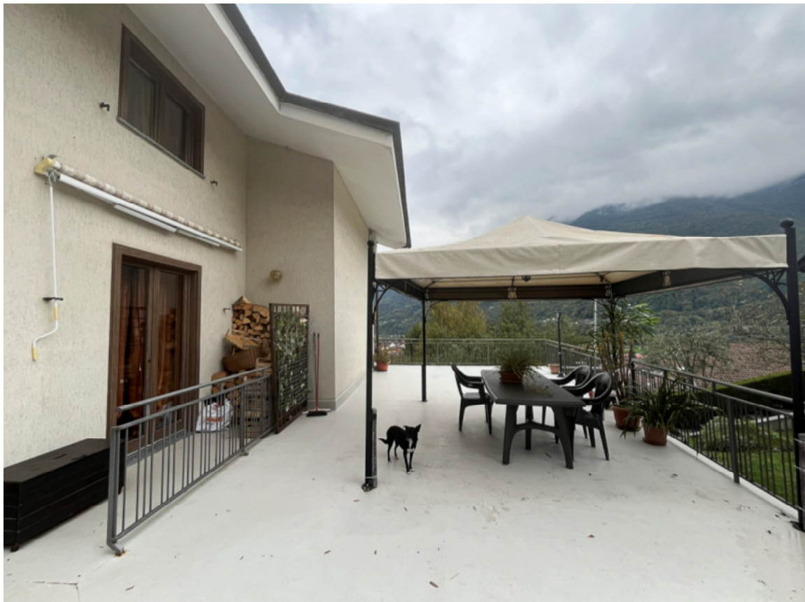
19_vista esterna_terrazzo lotto II