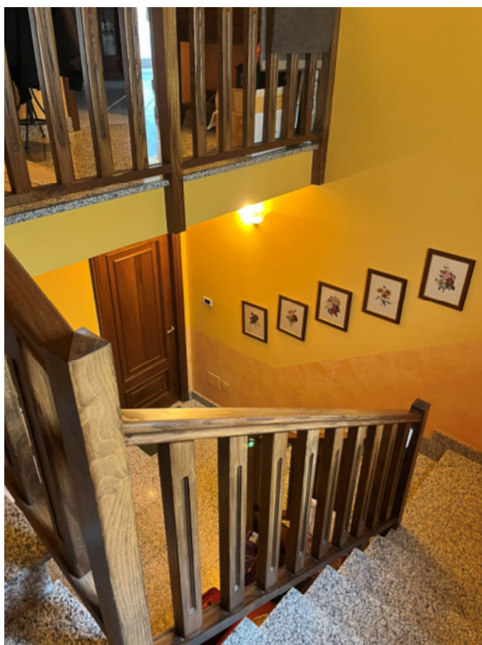
22_vano scale da P2 a P1